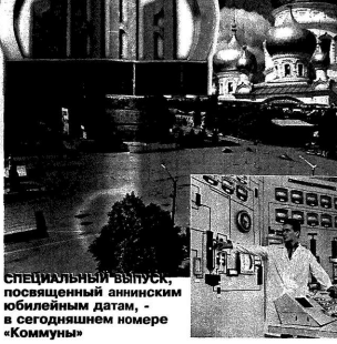
СПЕЦИАЛЬНЫЙ ВЫПУСК, посвященный аннинским юбилейным датам, в сегодняшнем номере «Коммуны»