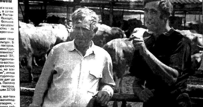
Сотрудник Восточной... Сотрудник Восточной... Сотрудник Восточной...