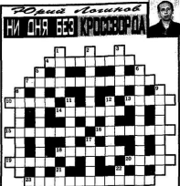
В пятницу поступит подробное описание от читателей...