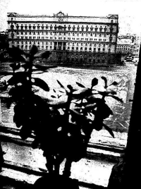
Домиком в центре Лубянки рынка в торговле.