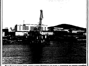
Порт-10 в своем налете, когда в море Ледовый щит льдет: удерживать на плаву корабль...

СЕВЕРНЫЙ ПОРТ, В ВЫПУСК ВРЕМЕНА СТАВИШИЙ РЕКОРДЫ ОБРАБОТКИ ГРУЗОВ, НЫНЕ ВЛАЧИТ ЖАЛКОЕ СУЩЕСТВОВАНИЕ