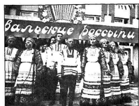
Четверо из группы танцевального ансамбля «Вальсовые веселыи»...