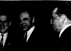
Ветхий Сталин Агеевскому до сих пор считают умелым и опытным.

Слова Агеевского были направлены на то, чтобы показать, что Сталин не только умелый и опытный, но и талантливый и блестящий оратор. Именно в этот раз он произнес речь, которая стала для многих из нас уроком. Слова Агеевского были направлены на то, чтобы показать, что Сталин не только умелый и опытный, но и талантливый и блестящий оратор. Именно в этот раз он произнес речь, которая стала для многих из нас уроком.