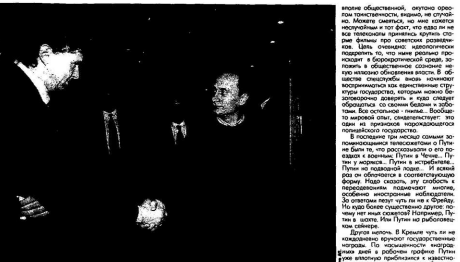
Этот вечер проходил в атмосфере дружеского сотрудничества.