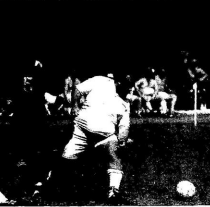
Во время матча, игра в Краснодаре - кандидатом в сборную...

После окончания чемпионата мира по футболу в Москве и Ленинграде, в Сочи соберутся депутаты, министры и мэры. Они будут участвовать в турнире. Они будут играть за свои команды. Они будут бороться за победу. Они будут бороться за славу. Они будут бороться за честь.