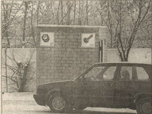
«Ну и ну!» - хочется воскликнуть, глядя на фото Сергея Губанова, которое он сделал на Ростовской трассе.