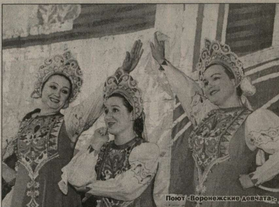
Поют «Воронежские девчата».

Один за другим сменяли сцену народные и профессиональные коллек-