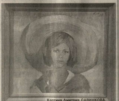
Картина Дмитрия САВИНКОВА.