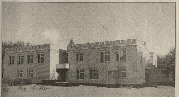
Детский сад на 140 мест, построенный силами ОАО «Связьстрой-1».