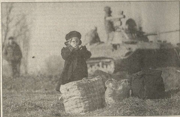
«Рябятишки пошли по миру...» (А.С. Пушкин. История села Горюхино)

НОВОСИБИРСКАЯ УЧИТЕЛЬНИЦА ДЕСЯТЬ ЛЕТ ПРОВЕЛА В ПЕЗДКАХ ПО «ГОРЯЧИМ ТОЧКАМ», СКРЕПЛЯЯ МИЛОСЕРДИЕМ ВЗВОЗВАННОЕ ПРОСТРАНСТВО БЫВШЕГО СОВЕТСКОГО СОЮЗА