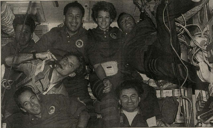
Кроме тяжелой работы, обитателям «Мира» есть что вспомнить и веселого, и трогательного.