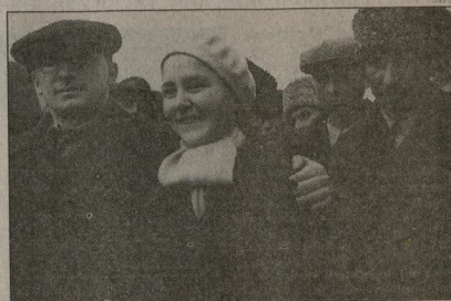
Два Лаврентия: Берия и Цанаву (справа).

О себе он любил говорить так: «В стране есть только два настоящих Лаврентия: Лаврентий Павлович и я - Лаврентий Фомич». И это было верно. Лаврентия Цанаву боялись лишь чутьочку меньше, чем его шефа - Берии.