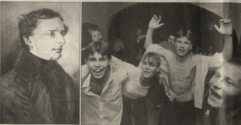
Владимир Даль и сегодняшние носители славянского и могучего: поняли бы они друг друга?

НА КАКОМ ЖЕ ЯЗЫКЕ МЫ С ВАМИ СЕГОДНЯ ГОВОРИМ?