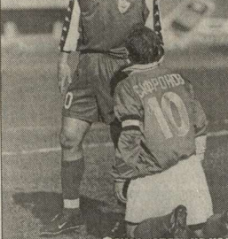
«Факел» опять на коленях.