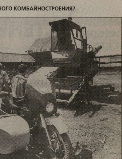
Старушка «Нива» давно пора на покой, но где взять деньги на новый комбайн?

1500» так и не смог вытеснить старушку «Ниву», поскольку эффективно работает только на полях с высокой урожайностью. Но надо найти еще и деньги для покупки новой машины на производство. Чтобы получить кредит в ситуации, когда на «Ростсельмаше» висит 2,5 миллиарда долгов, надо изобрести. А деньги требуются большие. Вся программа развития комбайнового бизнеса группы «Новое сотрудничество», рассчитанная на 10 лет, оценивается в 5 миллиардов рублей.