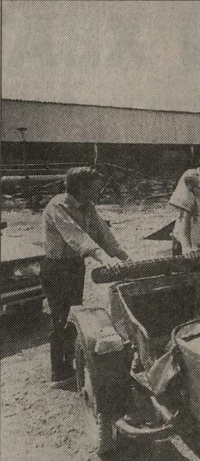
Старушка «Нива» давно пора на покой, но где взять деньги на новый комбайн?

На «Ростсельмаше» по этому поводу не очень-то переживают. Дескать, мы сами с усами, выведем свою технику на мировой уровень и с российским стратегическим инвестором. В конце 1999 года «Ростсельмаш» и администрация области подписали соглашение с московской финансовой группой «Новое сотрудничество». Инвестор обязался выделить на оборотные средства завода и погашение задолженности по зарплате работников 500 млн. рублей. А администрация - способствовать приобретению группой контрольного пакета акций «Ростсельмаша» и предоставит налоговые льготы предприятию.