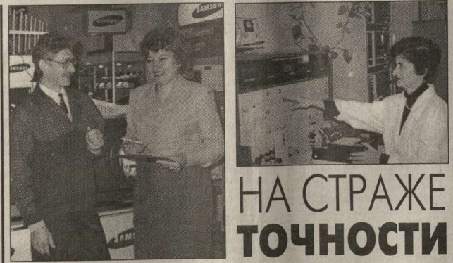
НА СТРАЖЕ ТОЧНОСТИ

Речь идет лишь о том, чтобы довести до 600 рублей общую сумму пенсий тем, кто получает ее в меньшем размере. Таким образом, сумма 600 руб. означает не минимальный размер