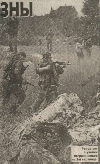
Репортаж с учений пограничников на 2-й странице.