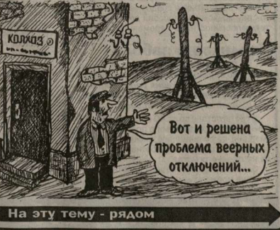
На эту тему - рядом