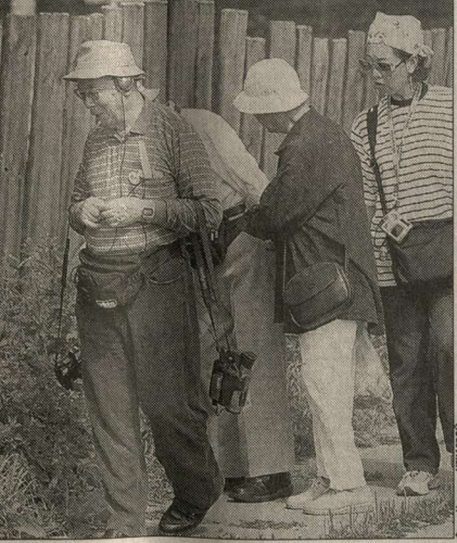
И в ближайшее время эта ситуация вряд ли исправится...