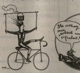
Книга Аркадия Давидовича иллюстрирована рисунками Виктора Ковалева.