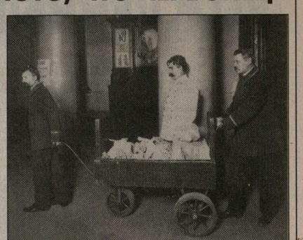
Санкт-Петербург это лет назад. Первоза золото в Гобсанке.

На днях Центробанк сообщил, что в обращение вводится золотой червонец. Потенциал ли у введения монеты родные рубли и неродные, но столь милые сердцу доллары? Собираются ли россияне хранить свои сбережения в червонцах? На эти вопросы отвечают люди известные и практичные.