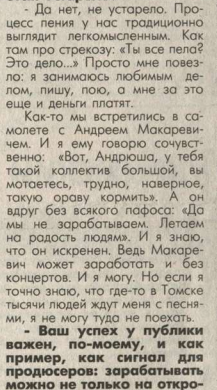
Олег Митяев.

— Вы не боитесь сползти в конъюнктуру? В последнее время у вас что ни песня, то хит. Это ведь опасно, потому что к вам придут все, кто захочет к вам в са-ба-бя. У меня сейчас искреннее стремление прочитать многие вещи, которые мы прошли в школе, и дополнить многое из того, что вертится в душе. И чтение, и писание доставляют мне колоссальное удовольствие. — А как касается мой хитов... Один генеральный человек скачал «Каждый пишет как он дышит...» Я хотел бы написать прозу, как у Платонова, какую-нибудь сложную философскую песню, какие выводят у Мирчаю, но у меня пока не хватает на это образования, знания, опыта жизненного. А вот когда человек специально снижает свой уровень, это и называется конъюнктура. Когда человек с высшим образованием, с прекрасной музыкальной выучкой, в достижимом, зрелом возрасте вдруг записывает альбом «Амвк» с клятвенным текстом, сразу же попадает в первую пятерку и сам себя не знает, что это такое конъюнктура, которая всех нас может откинуть далеко назад. Нет искренности, это только ремеслу, вот что такое конъюнктура. Даже талантливые, она убога. Что касается упреков в шлан-не, писание и безделье, то оно уходит на концерты.