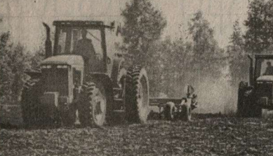
Американская техника на русском поле.