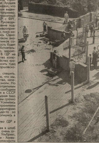
Август 1961-го: Берлинская стена росла на глазах изумленных немцев.

Вернем 12 августа нас собрали и сказали, что сегодня, в ночь с суббо-