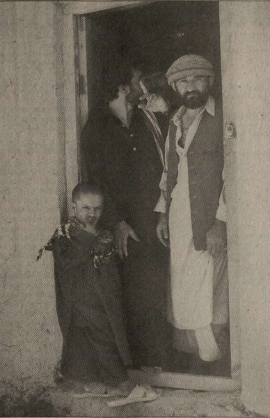
«Вони Аллах»: этот злобный кортик слышет мастерам переиздания глоток; справа - талиб Обидин.

Чтобы выйти из тюрьмы, талиб должен переосмыслиться. Первоначально заключенные в том, что он должен публично отречься от идеи ваххабизма. Не отречаются.