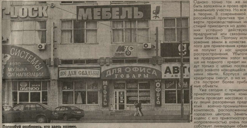
Попробуй разберись, кто здесь хозяин.

Проведение подобных «операций» очень поможет статья 29 Земельного кодекса, которая отдает приватизацию зем-