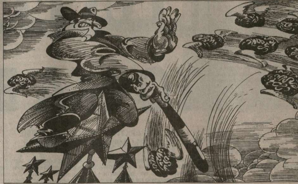
Иллюстрация: Владимир Школьников

НАЙДЕН НОВЫЙ СПОСОБ БОРЬБЫ С УТЕЧКОЙ МОЗГОВ: ИХ ОБЛАДАТЕЛЯМ ПРИКАЗАНО СДАТЬ ЗАГРАНИЧНЫЕ ПАСПОРТА