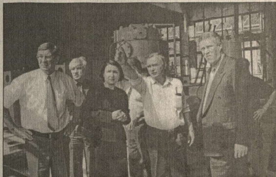
ЭТИ ДВА СНИМКА СДЕЛАНЫ С РАЗНИЦЕЙ ПОЧТИ В СОРОК ЛЕТ.

С праздником вас, друзья! Председатель областной Думы А.М. НАКАВИН Глава Воронежской области В.Г. КУЛАКОВ