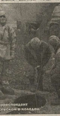
Наш корреспондент перед спуском в колодезь.

спускаемся коллектор чистить нас человек семь страхуют. Такие предосторожности вполне оправданы. Мало ли что. Вдруг какому-нибудь торродскому предпринятию, чтобы лишней раз не возиться, аду маемтся слить отходы производства, например кислоту, прямо в канализацию. Дело вполне обычное. Тогда по