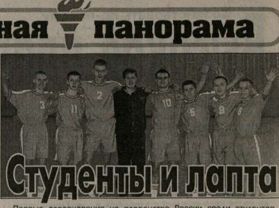
Студенты и лапта

Первые соревнования на первенство России среди студентов и учащихся средних специальных учебных заведений и ПТУ, пять дней длившиеся в спорткомплексе «Энергия», завершили триумфом команды Воронежского архитектурно-строительного университета.