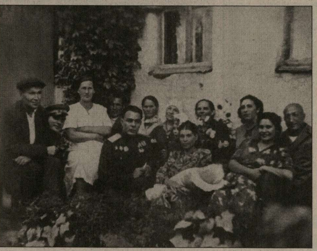
Днепродзержинск. Леонид Брежнев дома, с родной и соседями.