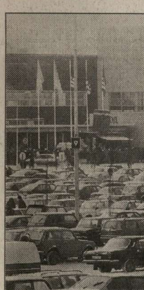
Вокруг магазинов ИКЕА в Москве - вечное столпотворение.

Большую половину объема закупок шведов в России - изделия из хорошо обработанной массивной древесины, то есть косяки, стеновые панели, которые в 62 странах. Когда я нахожу хорошего производителя в России, то мне говорят: