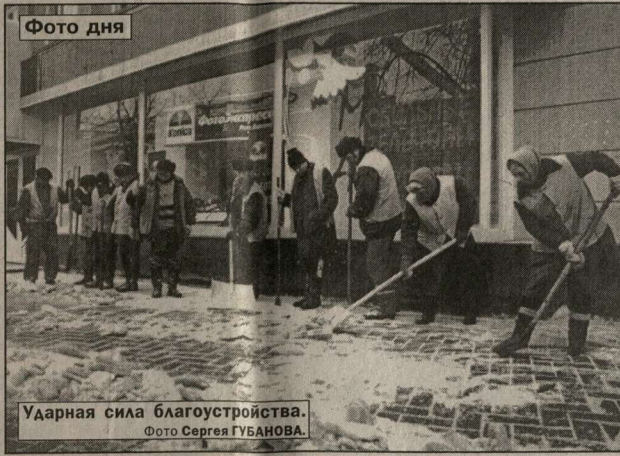
Ударная сила благоустройства.