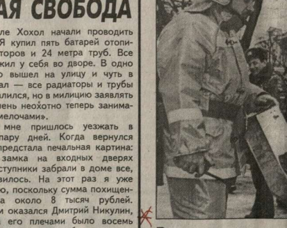
У пожарных - учения.