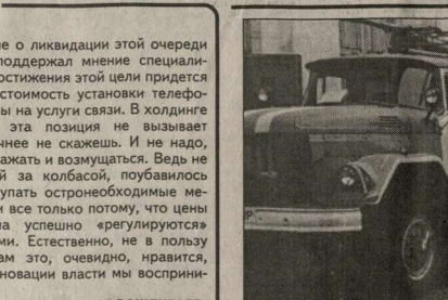
У пожарных - учения.