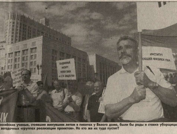
Российские ученые, стоявшие минулым летом в пикетах у Белого дома, были бы рады и ставке уборщицы в западных группах реализации проектов. Но кто же их туда пустит?

Ну а кому придется возвращать эти деньги? - вы договариваетесь. Игорь ЕЛКОВ.