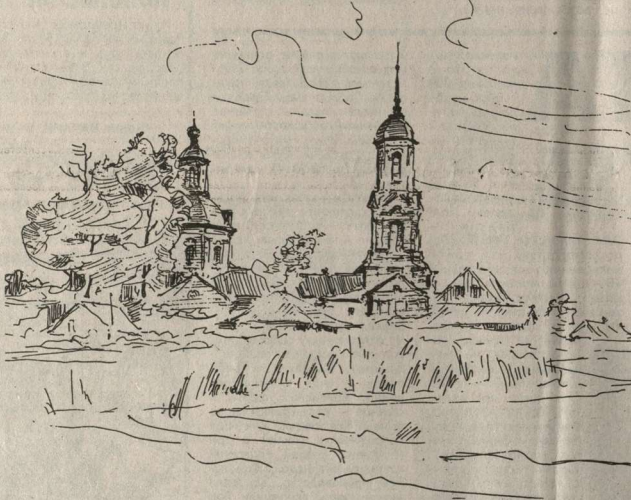
Острогожск. Вид на церковь Михаила Архангела. Рисунок Анатолия МАЗУХИ.