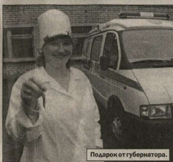
Подарок от губернатора.