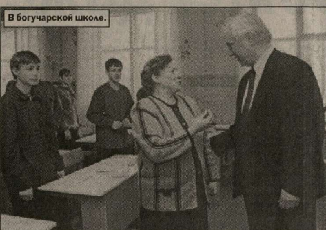
В богучарской школе.