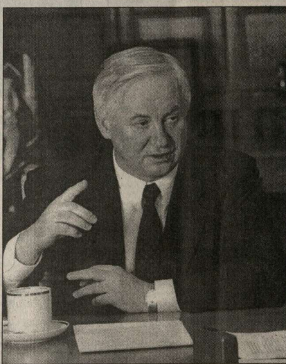
частник или финансовая структура, приобретает в кредит технику для ее использования в сельскохозяйственном производстве, получит от нас субсидию в размере до двух третей процентной ставки кредитования. Повторю: неважно, кто покупает эту технику, важно, чтобы она быстрее приходила в село и работала.

Выход из приведенных цифр и фактов напрашивается один: нужно незамедлительно увеличить насыщенность села техникой. Средства требуются огромные. Вот почему я подписал постановление, рассчитанное на три года, с тем, чтобы каждый из них стал «годом техники». Смысл постановления: любой, кто в течение этих трех лет, будь то хозяйство, предприятие,