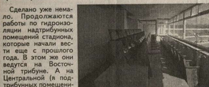
Ложа почетных гостей.