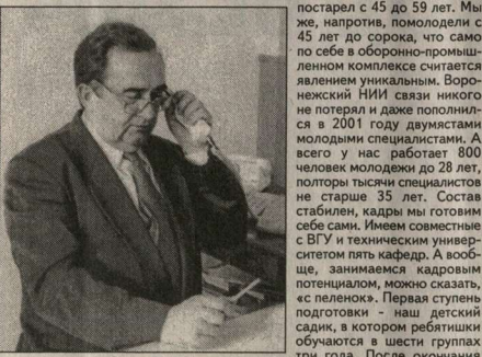
«Алтай», создавался в нашем институте. Поостался же мы только в последние 10 лет и не по собственной вине. Но это десятилетия ученые института не сидели сложа руки. У нас оказалось достаточно инновационных проектов, создано много новой техники, которую можно выпустить в серийном производстве. Но и «Акадеву» еще не самый последний. В ближайшее время у нас появятся новые комплексы, которые также послужат основой вооружения нашей армии. Сейчас надо запустить все это в производство. Правда, покупательная способность вооруженных сил невысока. А как найти механизм, чтобы Российская армия получила новую технику, и будет задачей нашего холдинга «Созвездие».

- Это вписывается в общие тенденции преобразования военно-промышленного комплекса, поскольку в начале 90-х годов были порушены все технологические цепочки. У нас тогда существовало научно-производственное объединение «Заря». Это фактически тот же холдинг, какой сегодня. Он даже был более крупным стабильным. В объединении традиция существовала, существовало научно-производственное объединение «Заря».