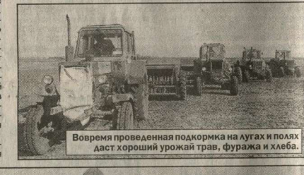
Впервые проведенная проверка на угах и полах даст хороший урожай трав, фуража и хлеба.

Понятно, что чем больше в окрестностях сельхозпредприятий, тем меньшим количеством земли они располагают. В «Большевик» всего две с половиной тысячи гектаров угодий, но несмотря на это, все отрасли сельхозпроизводства приносят здесь солидную прибыль. В прошлом году она составила 4 миллиона рублей, причем в растениеводстве и животноводстве выделялись распределены поровну. Минувшей осенью собраны отличные урожаи зерновых культур, сахарной свеклы, выращены подсолнечник, широко представленные сорта картофеля — в первую очередь кукуруза и многолетние травы. В колхозе большое внимание уделяется развитию животноводства. Молочное стадо красно-пестрой