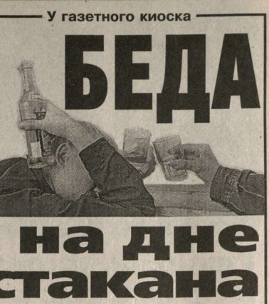
У газетного киоска