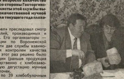
образцам. В дегустационном листе делались отметки о форме, цвете, вкусовых качествах мучных изделий. И в результате 9 образцов забраковано. В основном это была выпечка частных товаропроизводителей. Зато жюри, представленное специалистами вышеназванных двух областных управлений, дало положительные характеристики изделиям ОАО «Тобус» и АОТ «Хлебоубоючный №2», представляющим Воронежские удостоенные почетных грамот.

В последнее время в области возросло количество браха хлебоубоючных изделий со стороны Госторгинспекции. В прошлом году специалистами этой службы выявлено около пяти тонн недоброкачественной мучной продукции. Да и в первом квартале текущего года плохого хлеба выявлено немало. Цель «отделить зерна от плевел» преследовал смотр качества хлебоубоючных изделий, производимых и реализуемых в нашей области. Его организаторы — управление Росгосхлебинспекции по Воронежской области и Госторгинспекция. Эти две службы взаимосвязаны тем, что занимаются контролем качества выпускаемой продукции. Но на этот раз решено было отойти от сложившейся традиции (раньше продукция на смолооборачивание непосредственно с хлебоубоючных) и представить на закрытую дегустацию мучные изделия, взятые из торговых точек. Обмен мнениями состоялся по 39 хлебоубоючным