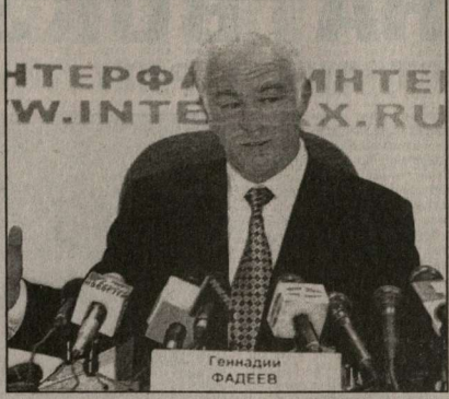
Все железные дороги, каждое предприятие в срок и в полном объеме выполнили налоговые обязательства перед государством, выплатив 21 миллиард рублей.

Если рассматривать итоги первого квартала, становится ясно, что министр не покинул душу и цели этой задачи. Все железные дороги, как и предприятия в срок и в полном объеме выполнили налоговые обязательства перед государством, выплаты 22 миллиарда рублей. По сравнению с вынужденным годом МПС перечислит в казну около 100 миллиардов рублей с учетом выплат реструктурированной задолженности. А сделать это он как непростой! В налоговом отношении Фадееву досталось весьма тяжелое наследство. Только в прошлом году по фактам неуплаты налогов предприятиями железнодорожного транспорта прокуратура возбудила 293 уголовных дела. Источники дохода у отрасли, как известно, два — перевозки,