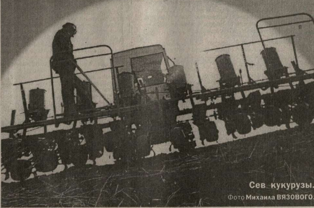
Сев кукурузы.