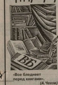
«Все бледнеет перед книгами» (А. Чехов).

Помните, когда мы с вами были еще маленькими, был такой наш праздник - «Книжкины именины». Ныне он уже стал Международным днем книги, который в конце апреля отмечается во всем мире. Воронежцы этот день выделили особо: накануне его состоялось юбилейное заседание «Воронежского библиофила», на котором любители книги отметили 30-летие работы своего сообщества.