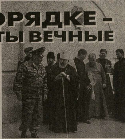
Так выглядела воронежская полиция.