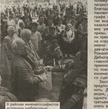
В районах кинематографистов встречали хлебом-солью.