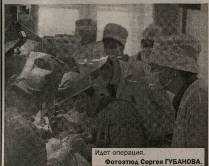
Идет операция.