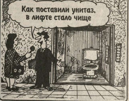
Как поставили унитаз, в лифте стало чище

Всегда на этом месте рисует Анатолий Бавыкин