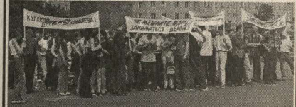
«Ковалев — наш мэр!», «Кулаков, держись Ковалева!» — с такими и подобными лозунгами прошел вчера митинг на главной площади Воронежа.