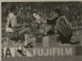
Романцев перестал быть президентом «Спартака»