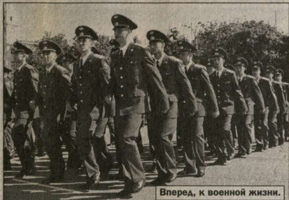
Вперед, к военной жизни.