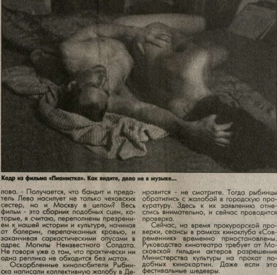
Кадр из фильма «Ианистка». Как видите, дело не в музыке...