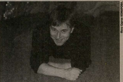
Герой Игорь Ливанов будет спасать Питер от ядерной катастрофы.

Это случилось с многократно отрепетированной в Голливуде атакой Америки?