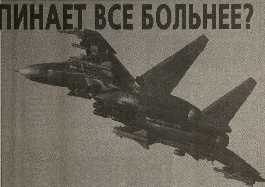
И крылья вроде бы еще есть, а летать на всевозможные салоны и выставки становится все опаснее.