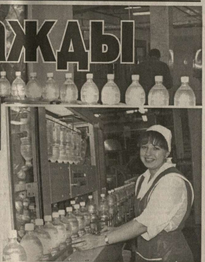
В лаборатории завода «Фруктовые воды» работают специалисты.