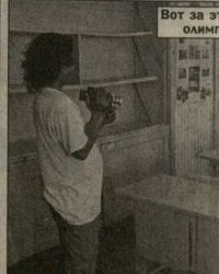
Вот за этой партией и сидела олимпийская чемпионка.