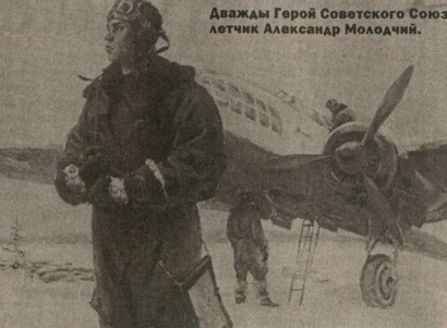
Дважды Герой Советского Союза летчик Александр Молодой.

«Портрет А.И. Молодого» впервые был показан на большой выставке, организованной в мае 1943 года в Центральном доме Советской Армии. Да, Александр Игнатьевич Молодой был одним из лучших наших летчиков в годы Великой Отечественной войны. Его хорошо знала вся страна.