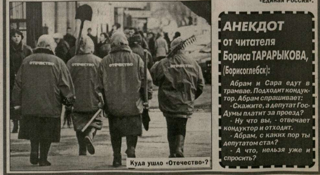
Куда ушло «Отечество»?