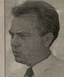
Сейчас начинаем работу по подбору своих кандидатов. Постараемся не ошибиться...