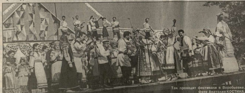
Так проходят фестивали в Воробьевке.