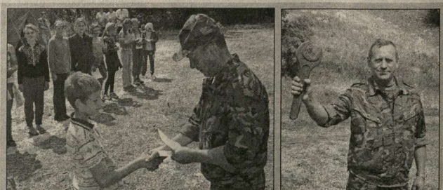
Состоялось закрытие лагеря «Спасатель», который располагался в селе Урьев Острогожского района на берегу реки Дон. Такой лагерь совместно с Воронежской областной поисково-спасательной службой и местной администрацией был организован для детей впервое. В платочном лагере почти месяц отдыхали 20 детей школьного возраста. Кроме обычных лагерных мероприятий, спасатели учили ребят плавать, а также работать с миноискателем. Новая смена не подкачала: наша и отпалапа огромный гаечный ключ. Алена ТАРУСКИХ.

Заместитель главы администрации области Юрий Савинков особо подчеркнул, что загорать в лагерях должны работать с максимальной полнотой все лето - тридцать смен. На совещании была поставлена конкретная задача перед всеми структурами, ответственными за проведение летнего отдыха наших детей, - в июле-августе необходимо дополнительно открыть 130 пришкольных оздоровительных лагерей с дневной формой пребывания, 155 профилирующих лагерей и около 400 трудовых объединений. Ну и, конечно же, очень важно, чтобы мальчишки и девчонки получали в лагерях сбалансированное качественное питание, чтобы отдых наших ребятишек был интерес-