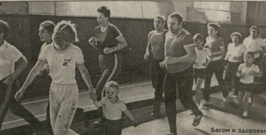
Бегом к здоровью.

Тел. факса 793225 рег. 30.03/1166. Продажи сертифицированы.