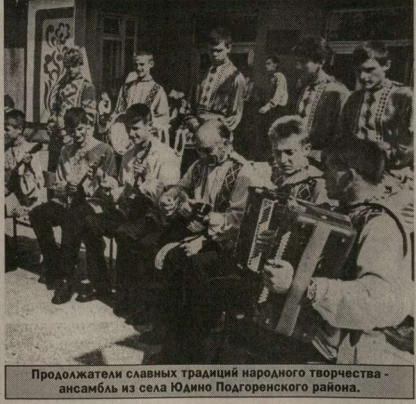
Продолжателем славных традиций народного творчества - ансамбля из села Юдино Подгоренского района.

тельности было сделано 19 выездов инструкторов сектора искусств обласно на места, послано 6 агитбригад для обслуживания колхозников и налаживания художественной самодеятельности в районах. Помимо этого, бесплатно разослано было - 417 экземпляров, методических пособий - 101 экземпляр и сотни экземпляров другой литературы, очень необходимой для самодеятельных артистов села.