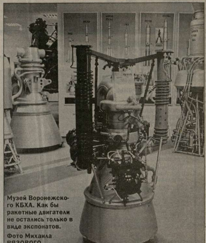
Музей Воронежского КХА, где бы ракетные двигатели не остались только в виде экспонатов.